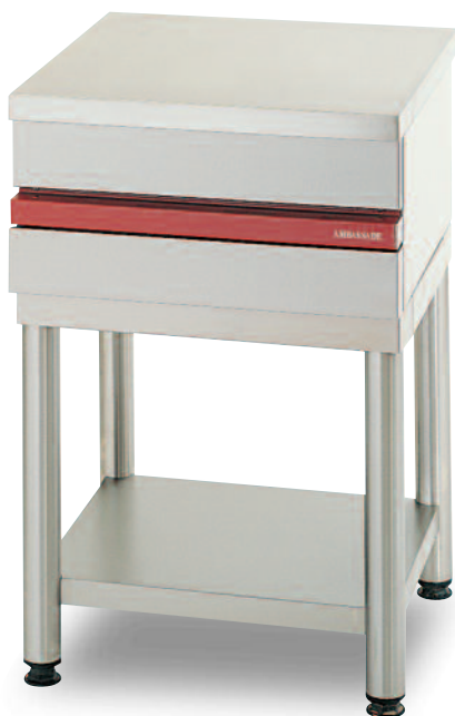
CSA 600 P. Plan de travail inox.