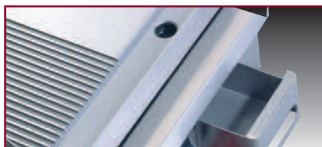
Tiroir de récupération des graisses

À fonction équivalente, les modules présentent les mêmes caractéristiques techniques et les mêmes performances que les modules sur armoires. Ils sont conçus pour être posés sur des supports adaptés en tube inox, mais ils peuvent tout aussi bien être installés sur des plans en inox ou encore sur un support carrelé.