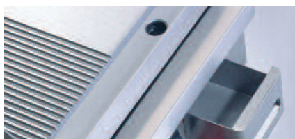
Tiroir de récupération des graisses.