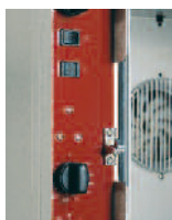
Tableau de commande d'accès aisé et utilisation simplifiée.

Enceinte construite en acier inoxydable à angles rayonnés assurant une très bonne circulation de l'air chaud, une grande régularité des cuissons et un entretien aisé. Mouflé de four étanche.